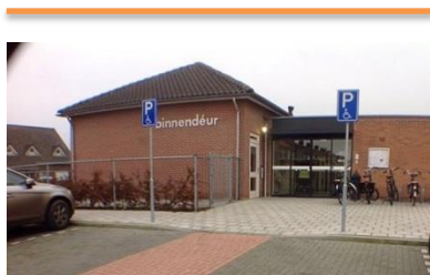
Het dorps-huis 'Binnendeur' te Kloosterzande.